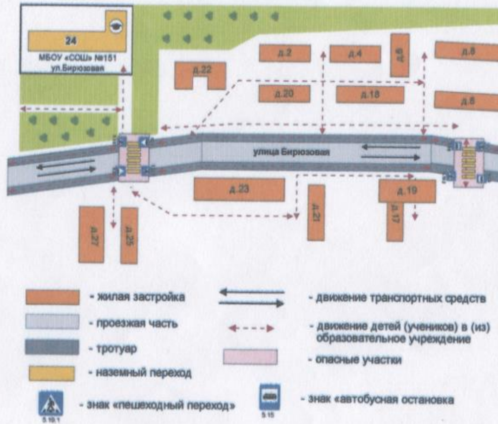
1а. Район расположения образовательного учреждения, пути движения транспортных средств и детей (обучающихся, воспитанников)